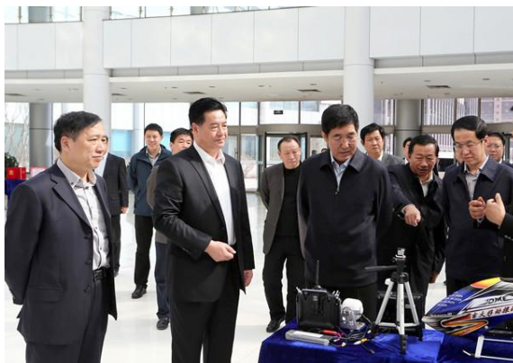
吉林省委书记巴音朝鲁，省委常委、长春市委书记高广滨，省委常委、省委秘书长房俐等一行，在吉林大学党委书记杨振斌、校长李元元等校领导陪同下，来到吉林大学国家大学科技园调研研究生创新创业工作。

当前，“大众创业、万众创新”已成为国家战略，我校学生就业创业指导与服务中心也与时俱进，积极适应并引领“新常态”，不断完善学校创新创业教育及大学生自主创业工作的体制机制建设，在学校创新创业工作领导小组和创新创业教育指导委员会的领导下，充分发挥各部门的联动作用，密切配合，协同推进，创造性地开展工作。2015年，我校成功申请2015年吉林省政府创业专项经费450万元，为学校有效推进大学生创新创业教育与实践提供了经费保障。加强创业指导课程建设，针对本专科一年级学生开设《创业基础》必修课，培养学生的创业能力，对二三年级学生开设《创业实训》选修课，培养学生的创业核心能力；针对不同的创业学生群体有效开展创业沙龙、创业工作坊、创业培训等，各学院也广泛利用社会资源开展丰富多彩的创新创业教育与指导活动，在全校范围内营造了浓厚的创新创业氛围。积极开展创新创业研究，省级课题立项11项，校级课题立项31项。创建吉林大学创新创业服务网，实现集政策发布、教育引导、信息集散、资源共享、管理咨询、成果转化“六位一体”的创新创业信息平台，为创客和投资者搭建畅通的对接平台。完善校内3个创新创业实训平台建设，依托各校区的学科和资源优势，新建11个创新创业实训基地，依托创新创业教育学院建立了吉林省高校首个i-Flame创客空间，发挥不同学部、学院的学科优势，创建了创业苗圃、创业咖啡；积极与人社厅、工信厅、教育厅等政府相关部门、各地商会、校友会和社会企业广泛联系，共建开放共享的创业生态环境。2015年7月30日，我校实践育人创新创业基地成功入选首批“全国高校实践育人创新创业基地”单位；目前，我校创新创业工作呈现积极活跃态势，各项工作扎实稳步推进，受到中央、省、市各级领导的高度肯定和一致好评。