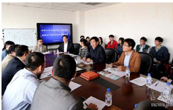
吉林省委书记巴音朝鲁视察吉林大学学生就业创业指导与服务中心组织的创业沙龙并与师生亲切交流