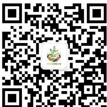
艾克热木正能量工作室