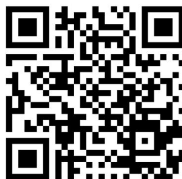
（北京化工大学研究生家庭经济情况调查问卷二维码）