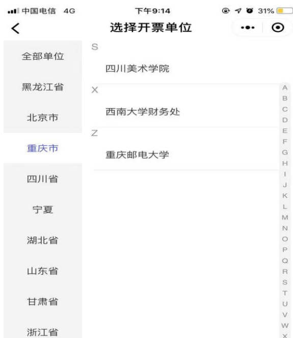
(2) 选择或定位开票单位