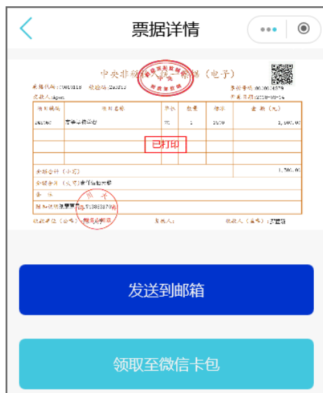
(5) 电子票据查看及下载