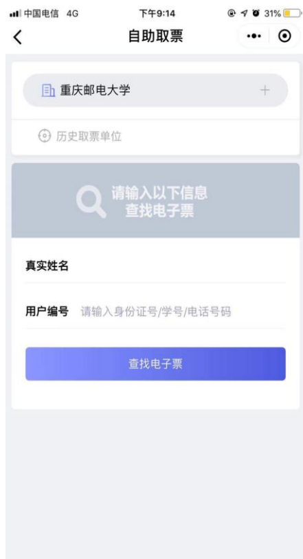
(3) 首次使用时输入学号或者身份证信息