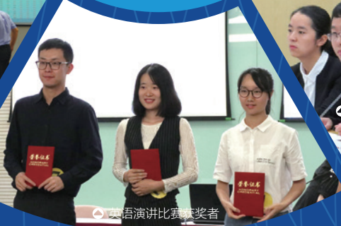
▶ 英语演讲比赛获奖者