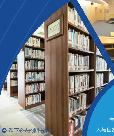
◀ 课下必去的图书馆