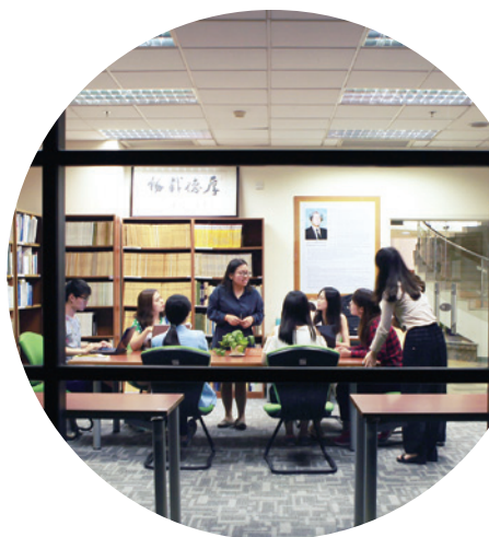
课下的案例研讨热烈依旧