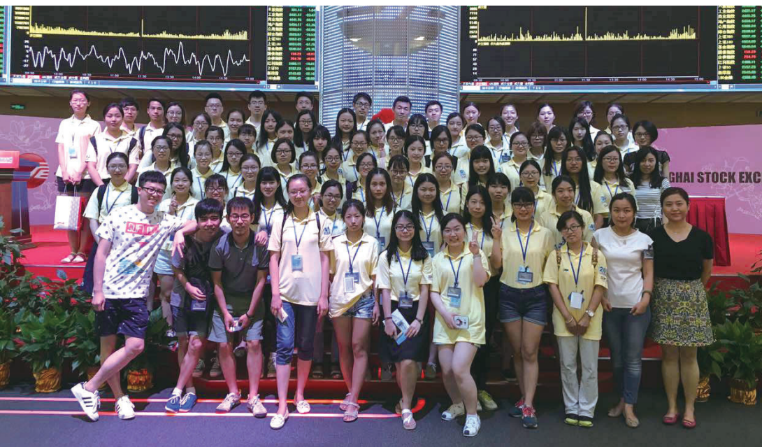
赴上海证券交易所学习交流