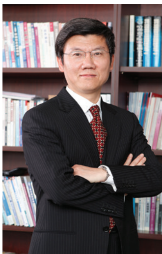
上海国家会计学院 院长